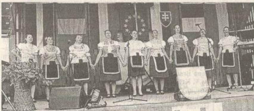
Účinkujúci kultúrneho festivalu.