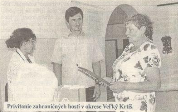
Privítanie zahraničných hostí v okrese Veľký Krtíš.

Prax partnerských miest vznikla v Európe po druhej svetovej vojne ako spôsob priviesť obyvateľov ku vzájomnému bližšiemu porozumeniu, a ako spôsob, ako podporiť cezhraničné styky. Najpopulárnejšia je táto koncepcia dodnes v Európe, či-