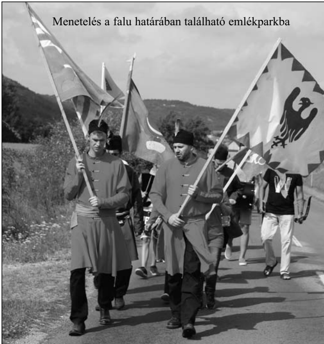
Menetelés a falu határában található emlékparkba

vérüket adó keresztények hadának emléke előtt. A történelmünkre büszkének kellene lennünk. Meríthetünk a történelemből. Értünk szól, maradjunk meg