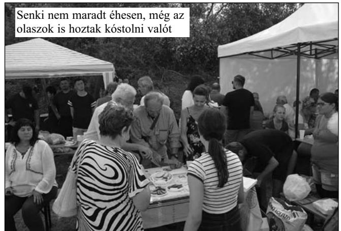
Senki nem maradt éhesen, még az olaszok is hoztak kóstolni valót

Erdélyből pedig citerazenekar szerepelt a fesztiválon.