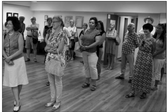
A megnyitó közönsége