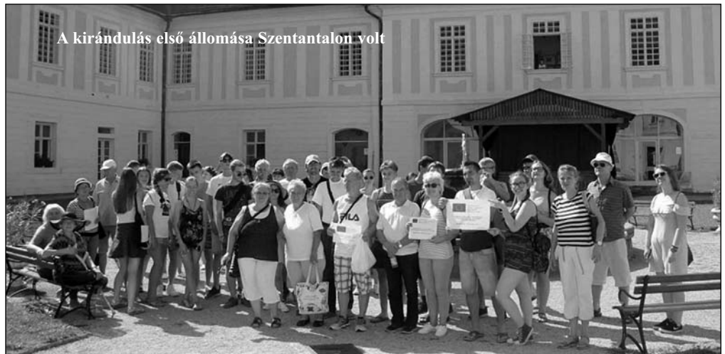
A kirándulás első állomása Szentantalon volt