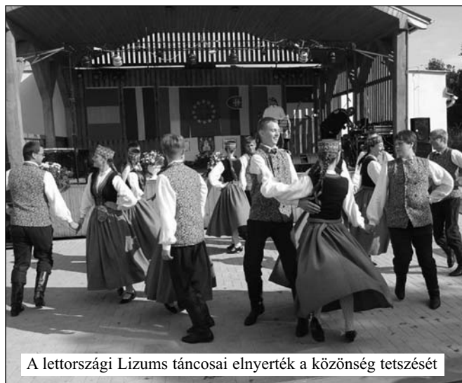
A lettországi Lizums táncosai elnyerték a közönség tetszését

A találkozó keretében szervezték meg az Üzen a múlt című rendezvényt a Csemadok helyi alapszervezetének közreműködésével. A délutáni programon a helyi és a környékbeli hagyományörző csoportok léptek fel.