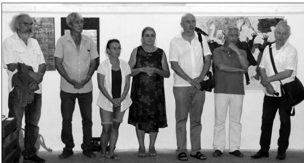
A kiállító művészek egy csoportja