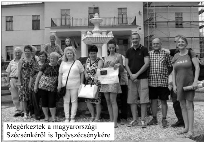
Megérkeztek a magyarországi Szécsénkéről is Ipolyszécsénykére

cséknével 2017-ben kötöttek testvértelepülési szerződést, az erdélyiekkel most fűződik szorosabbra a kapcsolat a hivatalos megállapodás megkötésével. A program többi résztvevőjével is